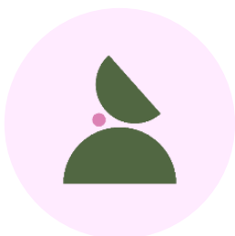
Prevención de riesgos laborales

Todo ello lo convierte en el tercer grupo de salud de España , con más de 100.000 clientes y más de 1.500.000 personas atendidas. Su actuación se centra en tres áreas diferenciadas: